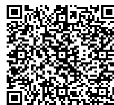
Mã QR của Sở Y tế

h. Thực hiện khai báo và thường xuyên cập nhật tình trạng sức khỏe bản thân cho nhà trường bằng cách Quét mã QR code của Sở Y tế như hình ảnh kế bên. Người học tự chịu trách nhiệm về việc tuân thủ quy định kê khai y tế của Sở y tế.