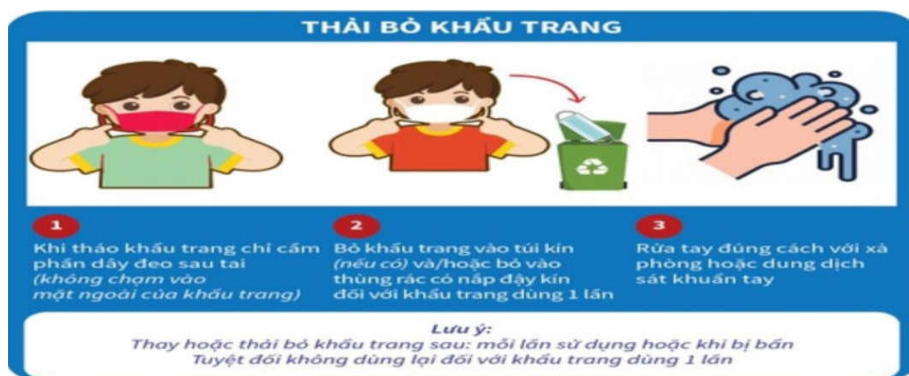
Hình 5: Cách tháo bỏ khẩu trang đúng cách

(Nguồn: Hướng dẫn lựa chọn và sử dụng khẩu trang Quyết định số 1444/QĐ-BYT ngày 29/3/2020)