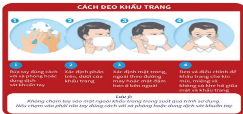
Hình 4: Cách đeo khẩu trang đúng cách

b. Đeo khẩu trang đúng cách nơi công cộng, trên phương tiện giao thông công cộng và đến cơ sở y tế (Hình 4, Hình 5).