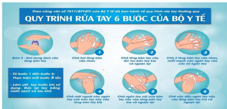
Hình 3: Các bước rửa tay theo hướng dẫn của Bộ Y tế

a. Thường xuyên rửa tay đúng cách bằng xà phòng dưới vòi nước sạch, hoặc bằng dung dịch sát khuẩn có cồn (ít nhất 60% cồn) (Hình 3).