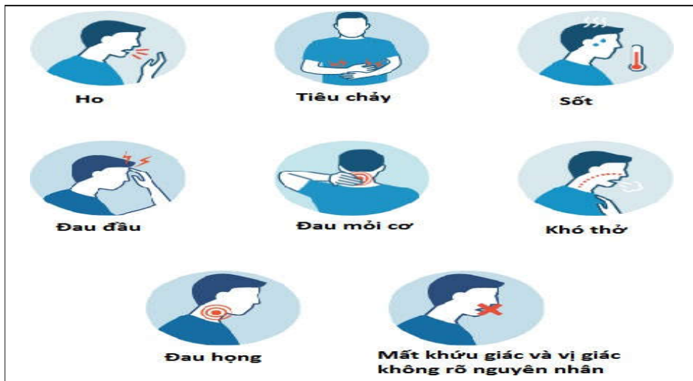
Hình 2. Các triệu chứng có thể gặp khi mắc COVID-19

Sau khi nhiễm vi rút SARS-CoV-2, các triệu chứng của bệnh COVID-19 có thể xuất hiện trong vòng 2-14 ngày, trung bình 5 ngày, người bị nhiễm vi rút có thể có các triệu chứng sau: Ho, sốt, khó thở, đau mỏi cơ, đau họng, không cảm nhận được mùi, vị không rõ nguyên nhân, tiêu chảy, đau đầu, đau ngực (Hình 2).